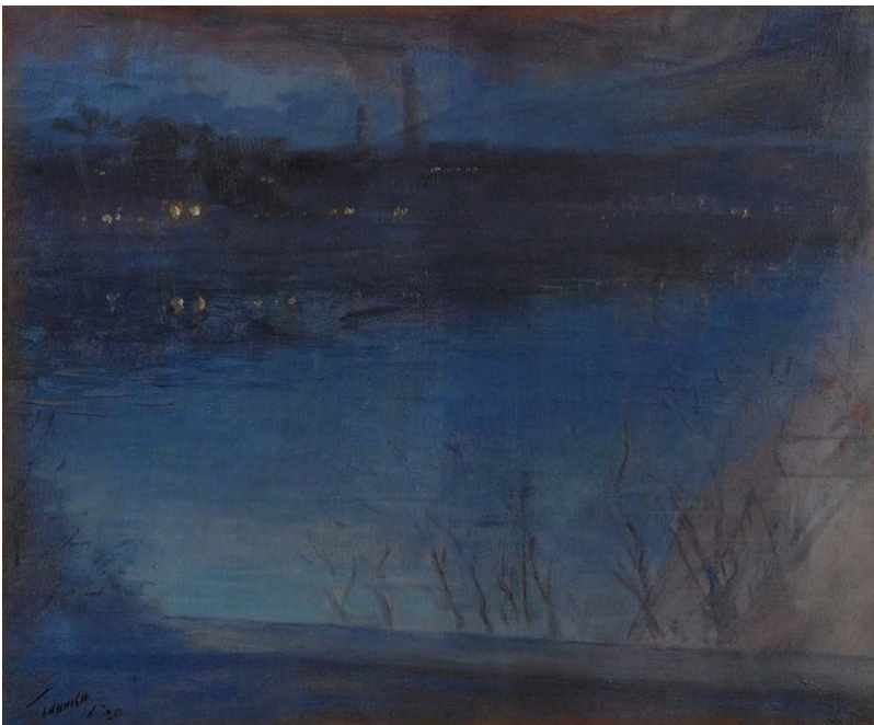
田中保《セーヌの宵》キャンヴァス、油彩