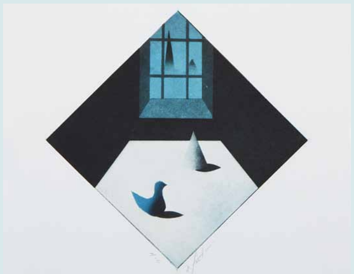
《旅の夜に》1976（昭和51）年 紙、アクリル

二見彰一（一九三二～）は、大阪に生まれ、戦後日本の銅版画界を支えてきた作家の一人です。幼いときから絵筆に親しんでいた彼は、長谷川潔の作品を見て、その深い諧調、ピロードのような絵肌に衝撃を受け、独学で銅版画を学びます。長谷