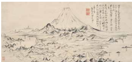
図2 中山高陽《八州勝地図》紙本墨画 安永6年（1777）個人蔵