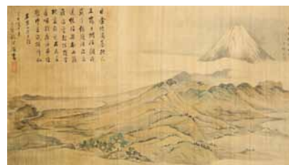
図1 大岡雲峰《日金山富嶽眺望図》葛布地着色 天保10年（1839）静岡県立美術館

雲峰は、今でこそ一般に名が通っているとは言い難い存在だが、当時は谷文晁（一七六三〜一八四〇）と並んで最高ランクの格付けが与えられていたわけである（註1）。雲峰は柳川藩立花家の家臣の子として生まれ、画は鈴木芙蓉（一七五二〜一八一六）に学んだ。「南嶺」とは、もちろん清人画家・沈南嶺（一六八二〜？）のこと。「雲の上迄」云々は、一応「雲峰」にかけてあるようだ。ついでに記せば、文晁への評には「海内に其名と、ろく写山楼三国一の富士の名人」とある。あまりといえばまっとうに過ぎる評なので、個人的には本編よりも序文や凡例の方がよほど面白く読める。