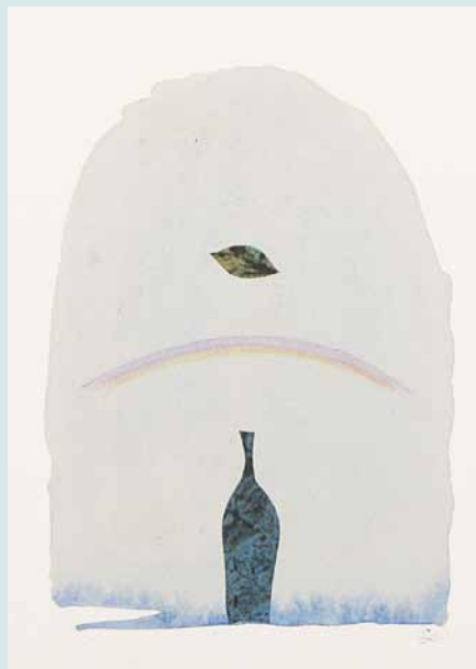
《一葉》1996（平成8）年 紙、水彩