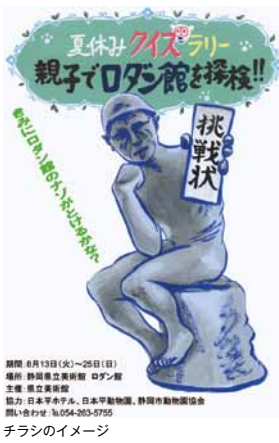
チラシのイメージ

「夏休みクイズラリー 親子でロダン館を探検」（八月十三日～二十五日）は、夏休み期間に実施し、大勢の方にご参加いただきました。参加者は解答用紙を手にロダン館を回って、作品付近に設置された看板に書かれた十問のクイズに答えます。ロダン館に初めて入られた方、これまでも何度か足を運んだことがある