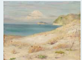
表紙の作品 黒田清輝 (1866-1924/慶応2-大正13) 《富士之図》(6点組)より 板、油彩 25.0×33.0cm 明治31年(1898)

〒422-8002 静岡市駿河区谷田53-2 総務課/Tel 054-263-5755 Fax 054-263-5767 学芸課/Tel 054-263-5857 Fax 054-263-5742