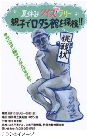
期間 8月13日(火)～25日(日) 場所 静岡県立美術館 ロダン館 主催 国立美術館 協力 日本平ホテル、日本平動物園、静岡県動物園協会 問い合わせ 054-363-5755 チラシのイメージ

「夏休みクイズラリー 親子でロダン館を探検」（八月十三日～二十五日）は、夏休み期間に実施し、大勢の方にご参加いただきました。参加者は解答用紙を手にロダン館を回って、作品付近に設置された看板に書かれた十問のクイズに答えます。ロダン館に初めて入られた方、これまでも何度か足を運んだことがある