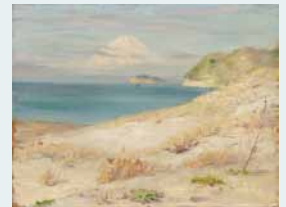
表紙の作品 黒田清輝 (1866-1924/慶応2-大正13) 《富士之図》(6点組)より 板、油彩 25.0×33.0cm 明治31年(1898)

〒422-8002 静岡市駿河区谷田53-2 総務課/Tel 054-263-5755 Fax 054-263-5767 学芸課/Tel 054-263-5857 Fax 054-263-5742