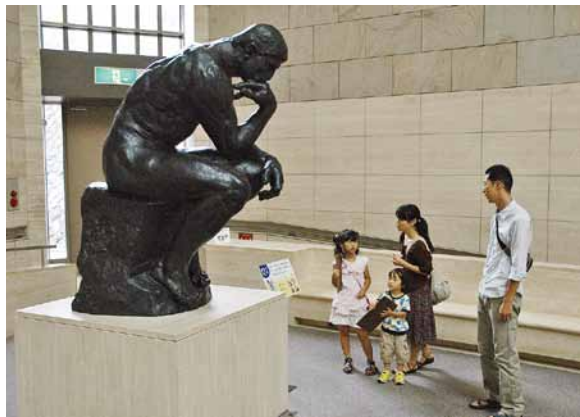
「夏休みクイズラリー 親子でロダン館を探検」の様子

という方も、クイズに答えるというちょっとした仕掛けを通して、重厚なロダン彫刻を身近に、なおかつ、いつもとは違う角度からご覧いただくのではないのでしょうか。全問正解者には抽選で、当館と有度山フレンドシップ協定を締結している日本