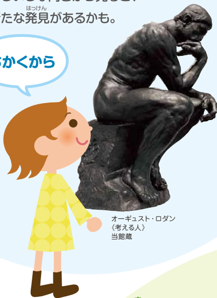
オーギュスト・ロダン 《考える人》 当館蔵