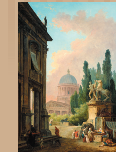
ユベール・ロベール 《モンテ・カヴァッロの巨像と聖堂の見える空想のローマ景観》 1786年頃 キャンバス、油彩 国立西洋美術館