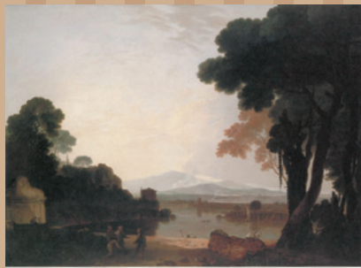
リチャード・ウィルソン《アクア・アチエーサ》 1754年頃 キャンバス、油彩 栃木県立美術館

今日の西欧世界の礎となった古代ローマ帝国。今も私たちが魅了するその文化遺産は、芸術家たちの手本やインスピレーションの源となってきました。18世紀のイタリアは、ポンペイなどの遺跡の発見・発掘によって考古学の面からも注目され、芸術分野に大きな刺激を与えました。古代の名所旧跡を描いた景観画、古代ローマにヒントを得た奇想画や装飾デザインが開花する一方、芸術家による考証作業に基づく著作も発表されます。本展は、都市ローマと南イタリアに残る古代ローマの遺産を主題として、古代に寄せる芸術家の情熱から生まれた多様な展開を、16世紀から18世紀にかけてたどります。考古学と芸術とが出会い、誕生した、想像力に満ちた作品が広がる世界をお楽しみください。 ※会期中、一部展示替えがあります。