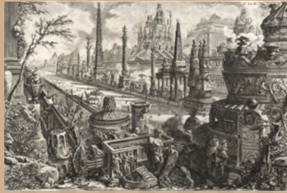
ジョヴァンニ・バッティスタ・ピラネージ 『ローマの古代遺跡』より「古代のマルスの競技場」 1756年 紙、エッチング 町田市立国際版画美術館