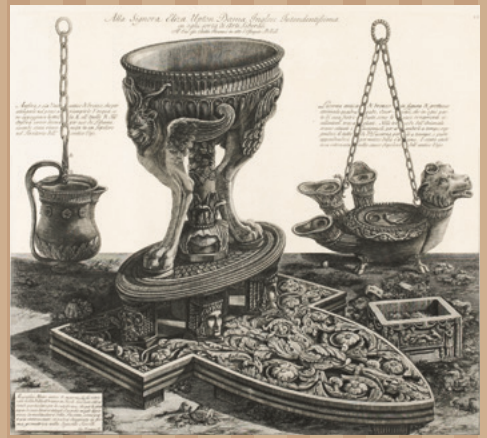
ジョヴァンニ・バッティスタ・ピラネージ 『古代の壺、燭台、石棺、三脚台、ランプそして古代の装飾』より 『ハドリアヌス帝別荘で発見された、大理石製の大きな供物台』 1778年 紙、エッチング 町田市立国際版画美術館