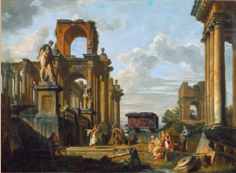
ジョヴァンニ・パオロ・パニーニ《古代建築と彫刻のカプリッチョ》 1745-50年頃 キャンバス、油彩 国立西洋美術館

今日の西欧世界の礎となった古代ローマ帝国。今も私たちが魅了するその文化遺産は、芸術家たちの手本やインスピレーションの源となってきました。18世紀のイタリアは、ポンペイなどの遺跡の発見・発掘によって考古学の面からも注目され、芸術分野に大きな刺激を与えました。古代の名所旧跡を描いた景観画、古代ローマにヒントを得た奇想画や装飾デザインが開花する一方、芸術家による考証作業に基づく著作も発表されます。本展は、都市ローマと南イタリアに残る古代ローマの遺産を主題として、古代に寄せる芸術家の情熱から生まれた多様な展開を、16世紀から18世紀にかけてたどります。考古学と芸術とが出会い、誕生した、想像力に満ちた作品が広がる世界をお楽しみください。 ※会期中、一部展示替えがあります。