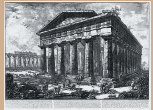
ジョヴァンニ・バッティスタ・ピラネージ、フランチェスコ・ピラネージ 『バエストゥムの古代遺跡の景観』より「(10)バエストゥムのボセイドン神殿」 1778年 黄の目紙、エッチング、エンブレヴィング 国立西洋美術館