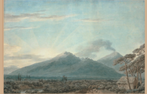
ジョン・ロバート・カズンズ《ボルティエーチからヴェスヴィオ山を望む》 1782年 紙、水彩、鉛筆 静岡県立美術館