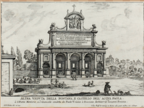
ジョヴァンニ・バッティスタ・ファルダ『ローマの泉』より「パオラ水道の泉とカステロ、別の景観」 1684年 紙、エッチング 町田市立国際版画美術館