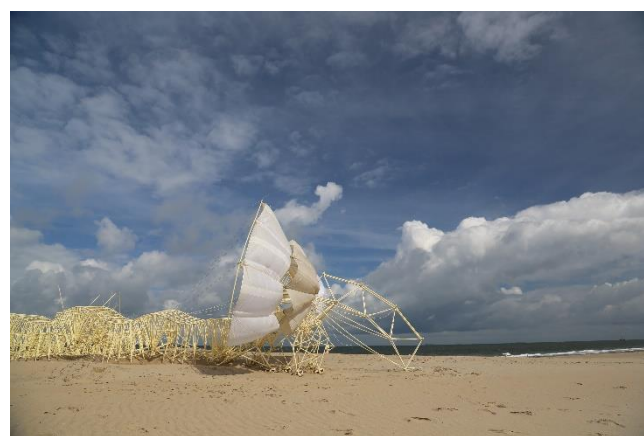
④ アニマリス・ムルス 2017