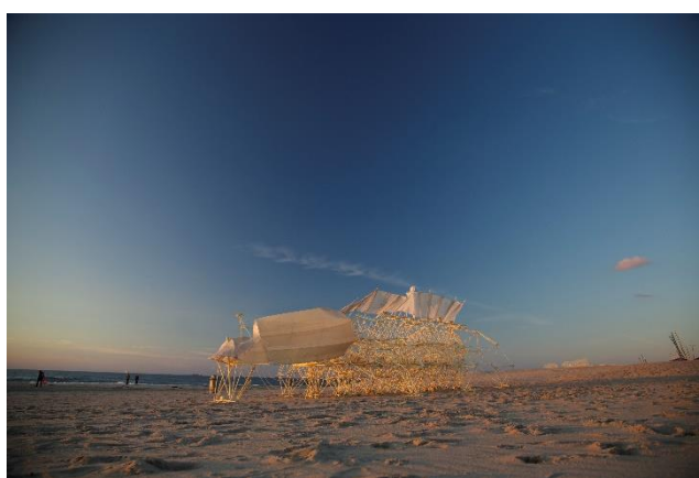
② アニマリス・オムニア・セグンダ 2018