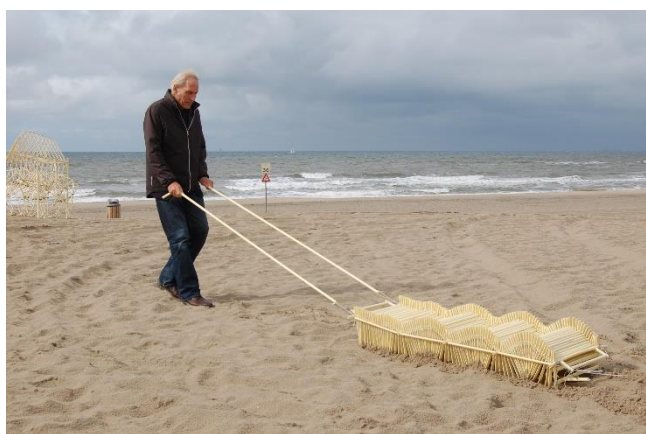
⑤ アニマリス・カリプス 2018