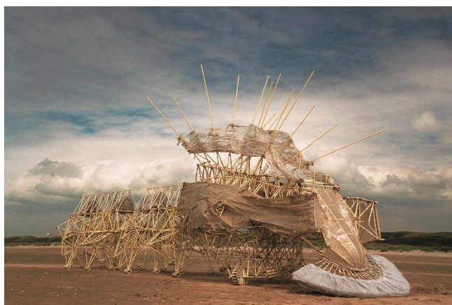
③ アニマリス・ペルシピエーレ・プリムス 2006