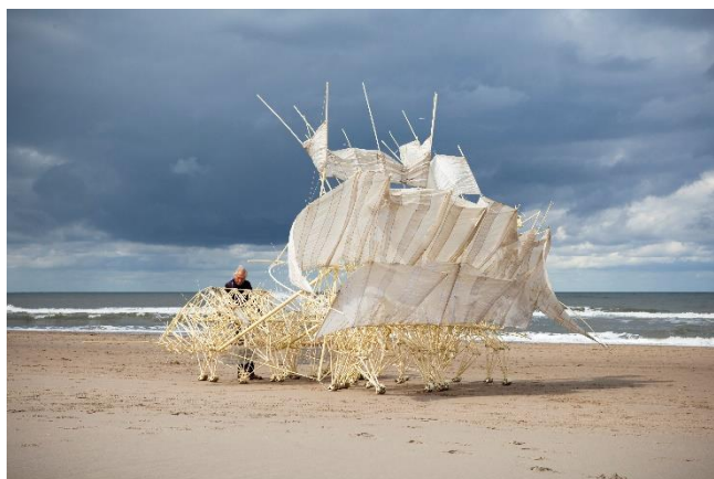
① アニマリス・プラウデンス・ヴェーラ 2013