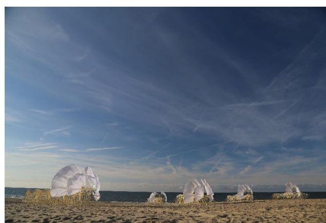
⑥ アニマリス・ウミナミ 2017