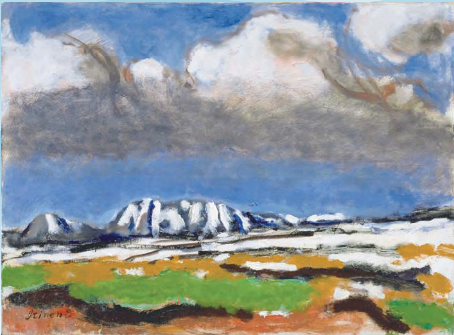
曾宮一念《毛無連峯》1970(昭和45)年 キャンヴァス、油彩