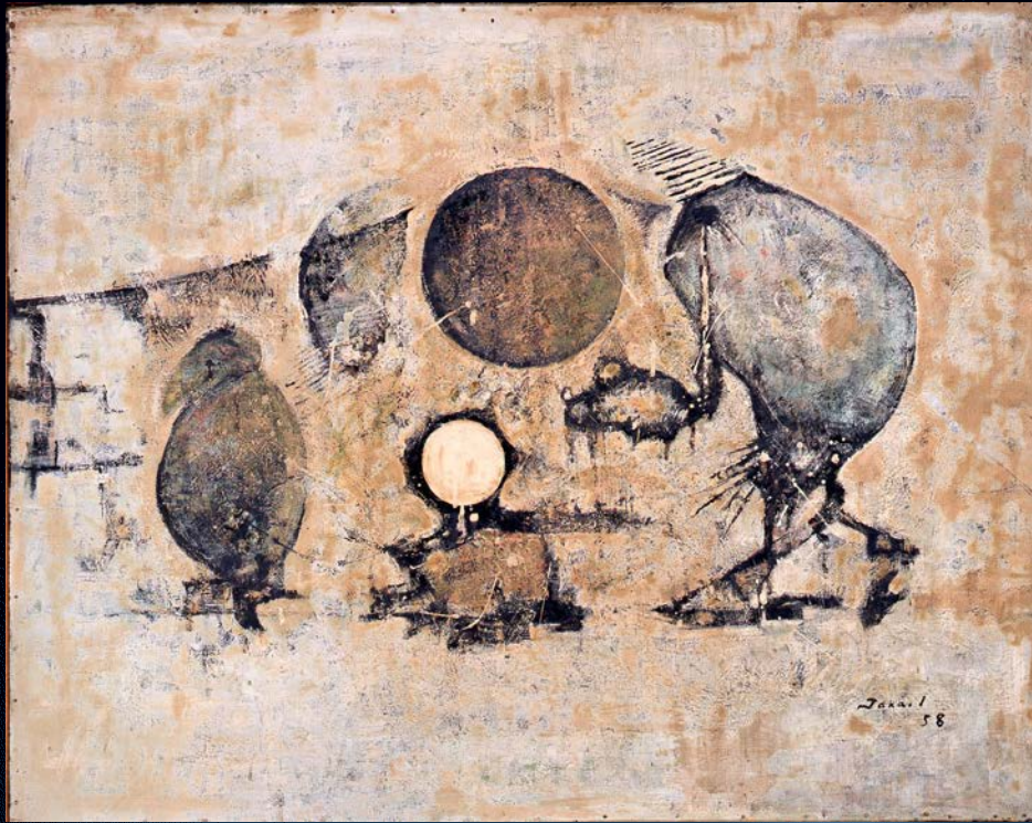
伊藤隆史《生き物》1958年

私たちが生きる世界を注意深く見渡してみると、「おやっ」と思われるような、小さな「不思議」に出会うことがあります。不思議な私たち、不思議な情景、不思議な動物…。そんな普段は見落としがちで小さな「不思議」は、しばしば表現の豊かさとなって、アートの世界を満たしています。この展覧会では、収蔵品の中から「不思議」を感じさせる作品をセレクトして展示し、美術表現の豊潤さや多様性を見直すことを試みます。アートが誘う「不思議」の世界を、どうぞお楽しみください。