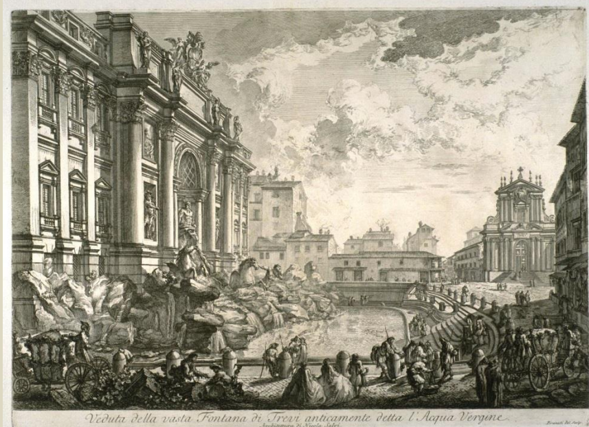
ジョヴァンニ・パットイスタ・ピラネージ『ローマの景観』より「トレヴィの泉」