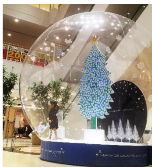
《巨大スノードーム》

幼少期のプリントゴッコ(簡易印刷機)の経験をきっかけに、シルクスクリーンによるTシャツの制作を開始。現在では、Tシャツに限らず、バルーンやさまざまな素材を用いた立体作品を制作し、国内外で現代アート作品の発表を行う。