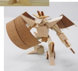
参考作品：常木教材株式会社