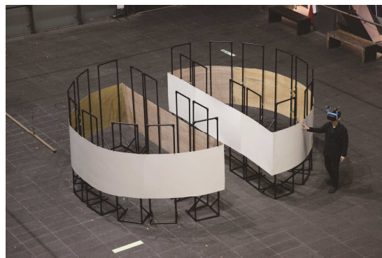
6 松本啓吾、鳴海拓志、築瀬洋平、伴祐樹、谷川智洋、廣瀬通孝(東京大学大学院廣瀬・谷川・鳴海研究室+Unity Japan)《Unlimited Corridor》2017年