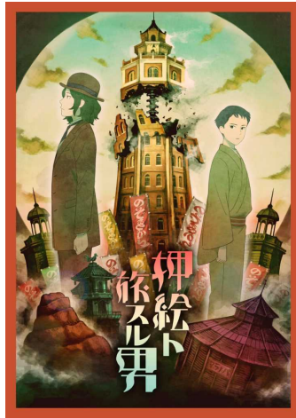
1 塚原重義 [監督]《押絵ト旅スル男》 (イメージイラスト) 2018年

【広報用画像】 展覧会広報用として作品画像をご用意しております。是非、本展をご紹介くださいますようお願いいたします。ご紹介いただける場合は、別紙の申込書に必要事項をご記入の上、FAX・E-mailにてご連絡ください。