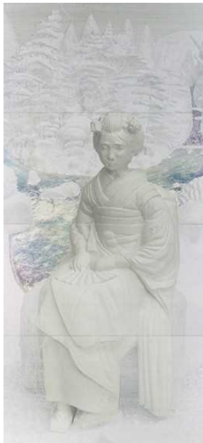
5 山田純嗣《(17-3) 舞妓林泉》2017年 作家蔵