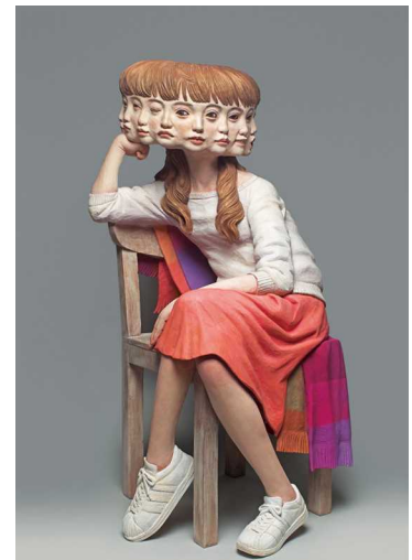
7 金巻芳俊《円環カプリス》2018年 作家蔵 ©Yoshitoshi Kanemaki, FUMA Contemporary Tokyo/文京アート