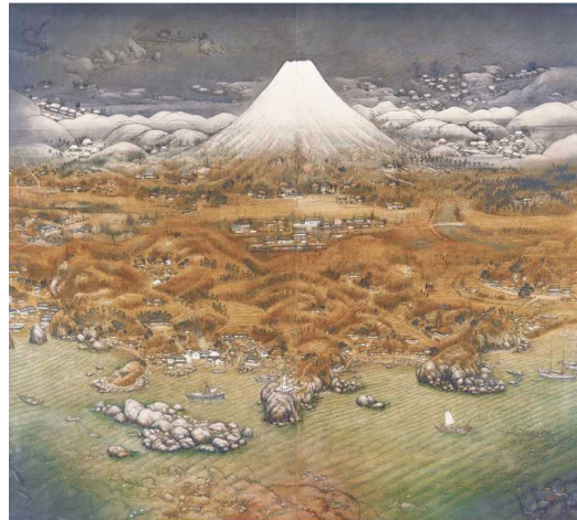
2 不染鉄《山海図絵(伊豆の追憶)》1925年 公益財団法人木下美術館