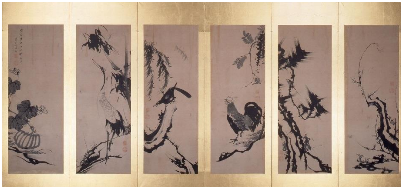
伊藤若冲《花鳥蔬菜図押絵貼屏風》(右隻)(個人蔵)