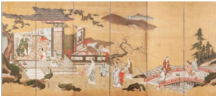
狩野益信《賢帝宮屏風》（左隻）（当館蔵）