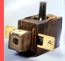
「風呂」と呼ばれる江戸時代の映写機

1800年の初めに、海外の映写機を改良し、木材で作られた映写機が登場します。上映すると、箱が熱くなることから映写機の本体を「風呂」と呼び、投影する絵を描いた板を「種板(たねいた)」と呼びました。この風呂と種板を使って、絵が動いているように上映することを「写し絵」と言います。この写し絵が、アニメのはじまりになりました。江戸時代では、「写し絵」は人の語りにあわせた劇として、当時の人々に親しまれました。