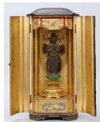
(左から) 図1 「井伊直虎・関口氏経連署状」 蜂前神社蔵・浜松市博物館保管 図2 「青葉の笛」 寺野六所神社蔵 図3 「世継観音像」 井伊谷 龍潭寺蔵