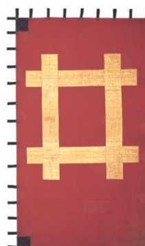
(左から) 図6 「井伊直政木像」 彦根 井伊神社蔵 図7 「朱漆塗花色糸威縫 延胸腰取三枚胴具足」 岡崎市美術博物館蔵 図8 「朱地井桁紋金箔押旗印」 (関ヶ原合戦所用) 彦根城博物館蔵

※会期中、展示品の入れ替えがあります。 前期：8/14～9/10 後期：9/12～10/12