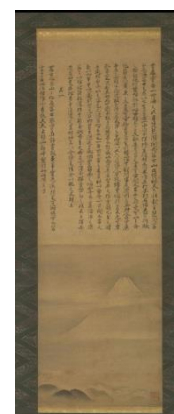
(左) 図4 「紅糸威腹巻」 静岡浅間神社蔵 (右) 図5 式部輝忠筆「富士八景図」より 静岡県立美術館蔵