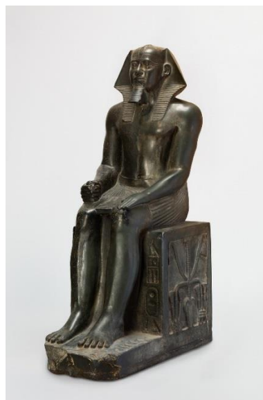
《カフラー王像》 古王国時代 第4王朝、カフラー王の治世(前2558～2532年頃)