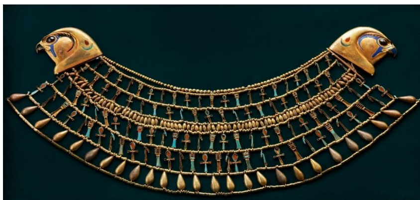
《クヌムト王女の襟飾り》 中王国時代 第12王朝、アメンエムハト2世の治世(前1911～1877年頃)