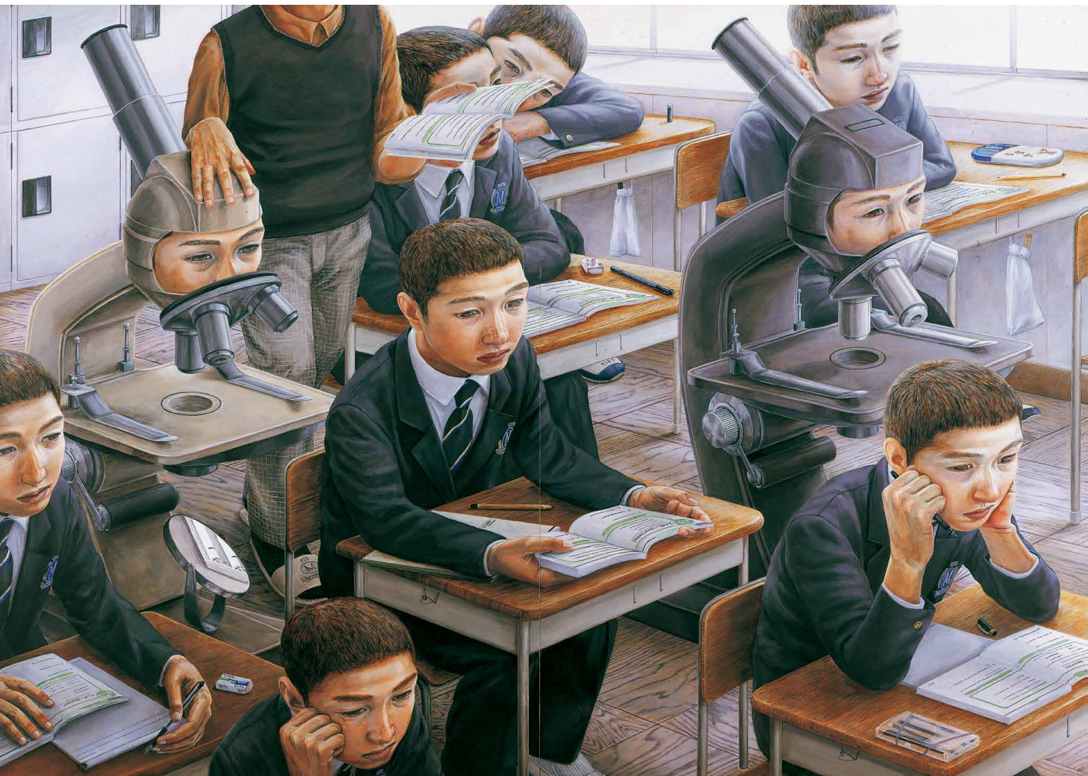
石田徹也《めばえ》1998年頃 板、アクリル 145.6×206.0cm

THE JOURNAL OF SHIZUOKA PREFECTURAL MUSEUM OF ART