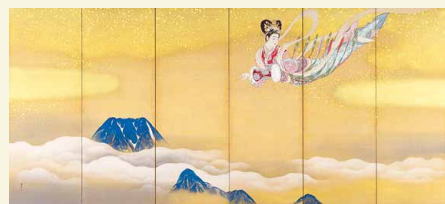
木村武山《羽衣》(左隻)