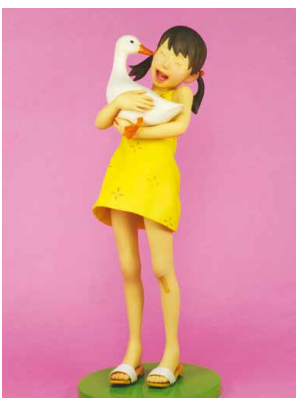
桜文鳥 《あかねちゃんとおひるちゃん》 2002年、作者蔵