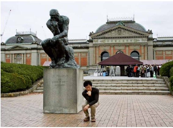
京都でも、ロダン体操。

そしてもう一つ、この静岡県立美術館の存在は、世界遺産富士山、原の白隠禪師に負けないくらい静岡の財産だと私は心からそう思っています。古今東西の幅広い分