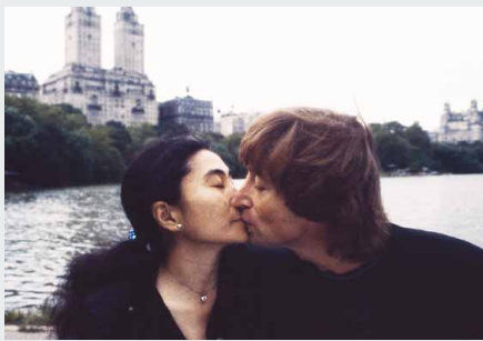
ジョン・レノン オノ・ヨーコ 1980年

篠山は、初期の造形的なヌードから、七〇年代の「激写」シリーズ、『Santa Fe』（宮沢りえ）、『water fruit』（樋口可南子）、そして最近では『20XX TOKYO』など、つねにヌードで社会現象を巻き起こしてきました。ヌードという人間の本来のあり方と社会常識・モラルとの葛藤を自ら続けてきたのです。