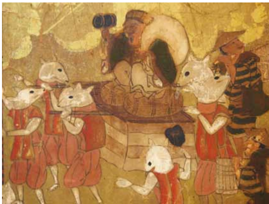
図2 江戸天下祭図屏風 左隻部分 仮装行列

この特集号刊行後も研究は重ねられ、二〇〇三年には見落とされていた先行研究の存在が八反裕太郎氏によって指摘された（1）。それは、昭和七年（一九三二）の「史