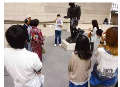
学生によるギャラリートークの様子

今回ギャラリートークに参加した学生五名は、いずれも普段は美術を専門に学んでいるわけではありませんが、言語文化学、社会学、経済学、法学といった学問を学んでいます。一見すると美術とは縁遠い学問のように思えます。では彼らに美術を見る眼は必要なのか。もちろんそんなことはありません。作品の中には未だ言語化されていない多くの知が潜