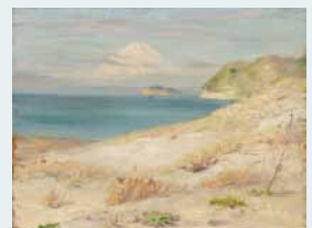
表紙の作品 黒田清輝 (1866-1924/慶応2-大正13) 《富士之図》(6点組)より 板、油彩 25.0×33.0cm 明治31年(1898)

〒422-8002 静岡市駿河区谷田53-2 総務課/Tel 054-263-5755 Fax 054-263-5767 学芸課/Tel 054-263-5857 Fax 054-263-5742