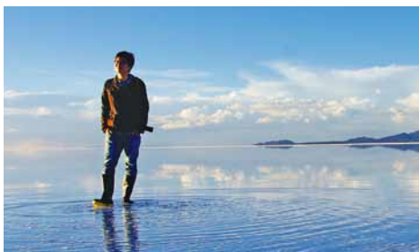
趣味は旅です。(2013年春 ウニ塩湖(ポリビア)にて)

その中で、自分に任された業務の一つが「特別観覧」（通称トツカン）担当です。「観覧」とはいうものの、現在はもっぱら研究目的や公共性が高い、あるいは当館の広報に資すると判断された特別な場合に限って、収蔵品の画像の貸出が主な業務です。内容は電話・Eメールのやり取り、書類の起案などがメインですが、商品開発する会社、テレビや新聞といったマスコミなど、各種業界の様子を窺うことができ、また収蔵品に詳しくなれることも、新入りとしてはありがたい限りです。