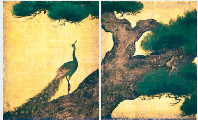
図1 狩野探幽《松に孔雀図》(元離宮二条城事務所) 重要文化財

崑山（一七九三～一八四一）などによって、近代に先駆ける様々な探究が絵画においても行われます。