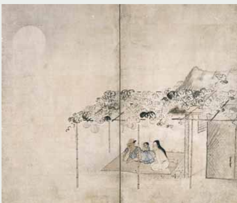
図2 久隅守景《納涼図屏風》(東京国立博物館) 国宝 後期展示 Image:TNM Image Archives

まずは、何といっても、狩野探幽《松に孔雀図》（元離宮二条城事務所 重要文化財 図1）をはじめとする、光かがやく障壁画や屏風の傑作・大作が一堂に会することです。久隅守景の《納涼図屏風》（東京国立博物館 国宝、後期展示 図2）のような、「徳川の平和」を一点で語ることもできるような名品、あるいは、池大雅の《柳下童子図屏風》（京都府 重要文化財 前期展示 図3）、与謝蕪村の《奥の細道図》（京都国立博物館 重要文化財）といった、一八世紀の絵画史を語るうえで外せ