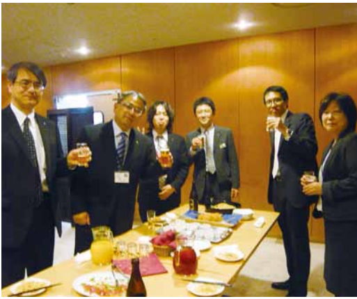
最優秀賞受賞後の懇親会於：県庁別館20階レストラン（右から三番目が筆者）

中でも一番印象に残っているのは、やはり平成二十四年度に開催した企画展「インカ帝国展」です。会期中、十万人近い入場者を集め、美術館の内外ともに大変な混雑となりました。美術館職員総出でその対応に当たり、大変だったなど