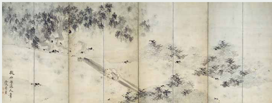
図3 池大雅《柳下童子図屏風》（京都府）重要文化財 前期展示

ない大作、そして、渡辺崋山《一掃百態図》（田原市博物館 重要文化財）など、一〇点余りの国宝・重要文化財が集結し、会場を彩ります。 次に、江戸絵画の魅力をグッと凝縮したポリウムと構成に注目いただきたいと思います。五〇名以上の