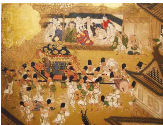
図1 江戸天下祭図屏風 右隻部分 神輿を見送る人々

本図は昭和初期まで、京都の本圀寺の所蔵品であったが、いつしか寺外へ流出し、行方不明になっていた。それが発見されて