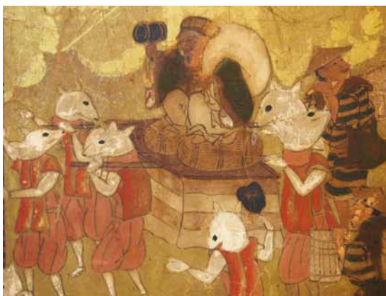
図2 江戸天下祭図屏風 左隻部分 仮装行列

この特集号刊行後も研究は重ねられ、二〇〇三年には見落とされていた先行研究の存在が八反裕太郎氏によって指摘された（1）。それは、昭和七年（一九三二）の「史