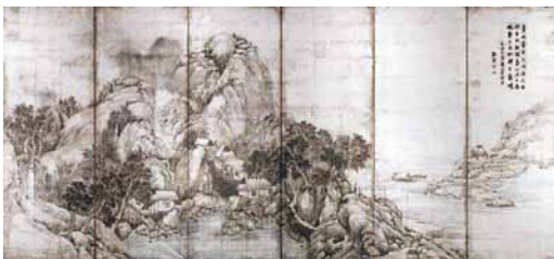
与謝蕪村《山水図屏風》(右隻) MIHO MUSEUM所蔵

このような竹田の立場を考えれば、現代の私たちは、竹田の大雅・蕪村優劣論にとらわれる必要など毛頭ないことになる。事実、現代では蕪村を愛する人の方が多いように思われる。私もその一人だ。とくに惹かれるのは、蕪村作品を貫いて流れる微妙な光の表現で、これを微光感覚と呼んだことがある。三大横物とたたえられる「峨嵋露頂図」「富岳列松図」「夜色楼台図」を一人の個性に帰着せしめるのは、微光感覚を