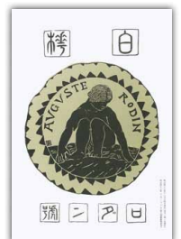
白樺 羅丹号 明治43年11月14日発行

要するに、一九一〇年前後、彫刻家ロダンの名声は欧米ではすでに不動のものとなり、極東の日本にまでいちはやく確実にとどいていたということであろう。この名声にさらに敏感に感じて、これを日本におけるロダン・ブームという以上にロダン・フィーヴァーにまで盛り上げたのが、鴎外「花子」の四ヶ月後に出た『白樺』明治四十三年十一月の「ロダン号」であった。同年(一九一〇)十