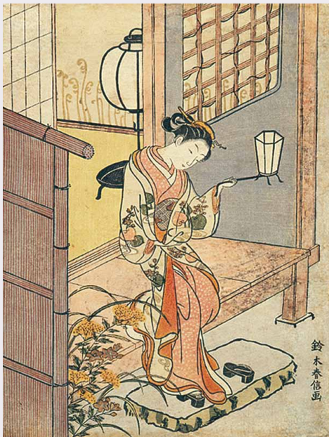
鈴木春信《秋の櫓》明和2～7年（1765～70） 島根県立美術館蔵（9月20日～10月19日展示） *会期中、一部展示替えを行います （前期：9月20日～10月19日／後期：10月21日～11月16日）

「美少女」は現代日本文化のひとつのアイコンとして世界中の注目を浴びています。著名キャラクターの国際的な人気や海外でのコスプレームはそれを象徴するものです。しかし本展はそういった目立つ事柄ばかりを紹介することが目的ではありません。美少女文化という流れの源を古美術にたどり、さらには現代アートやさまざまなキャラクターを通してその河口の広さを測るような展覧会にしてみたいと考えています。 たとえばわれわれは今回、浮世絵の鈴木春信に注目しています。今か