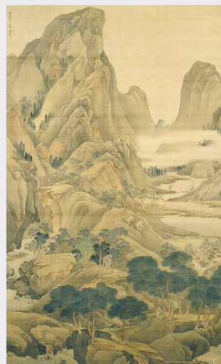
谷文晁《連山春色図》

上の風景を描いた作品はもちろん、実際の風景をもとにした作品でも、画家が画面上で空、海、山、人物、建物などのパーツを自由に選び取り、組み合わせることもあります。