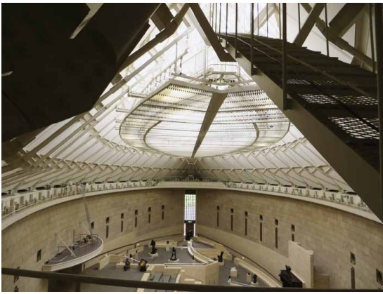
ロダン館のキャットウォーク

静岡県立美術館の設備のメンテナンスにかかわるようになって二十九年が経ちました。ロダン館の建物が完成した冬には雪が降り積もったのを覚えています。