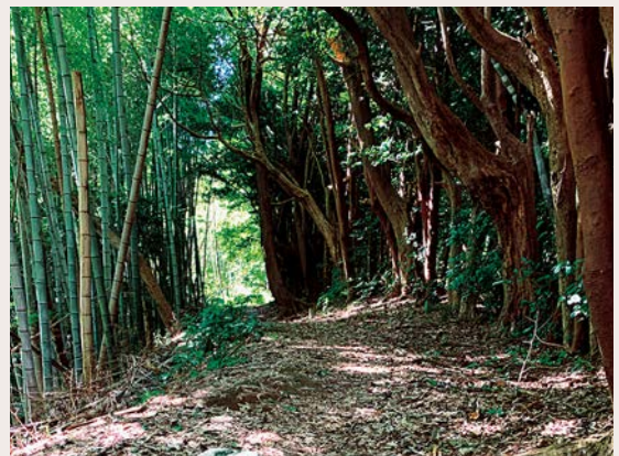
美術館の裏山の風景

従来の美術館の仕組みから観客を解放するさまざまな取り組みを発展させる試みが行われました。そしていよいよ秋に、展覧会はリレーのバトンを引き継いで静岡県立美術館へと会場を移します。アーティゾンという生き物も、美術館のコレクションという物も、時間や土地や風景とともに変化していくように、展示の構成も変化します。エ