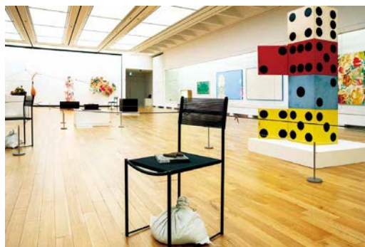
高松市美術館での展示風景 2022年

わたしたちはそれを「リレー展」と呼ぶことになった。行く先々の地勢や美術館の個性を活かし、対話を重んじ