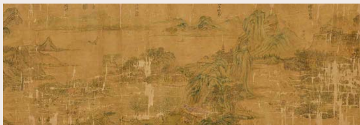
図2 伝文徵明《瀟湘八景図巻》(個人蔵) (部分)