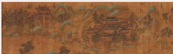
図1 《輞川図巻》(当館蔵) (部分)

本展に併せ、《蘭亭曲水図屏風》の作者である狩野永納、久隅守景、池大雅の優品、関連作品を展示します。いずれも厳選した優品ですが、なかでも、