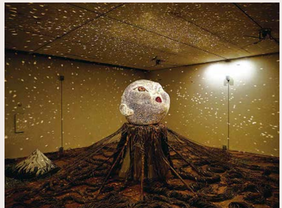
鴻池朋子《アースベイビー》2009

館の三館をリレーする新たな個展の準備が作家と三館の学芸員と共に進められてきました。展覧会は「みる誕生」と名付けられ、今年七月に最初の会場となる高松市美術館で展覧会が開幕しました。高松会場の様子は、本紙三ページに掲載の毛利直子氏の寄稿文をお読みいただくとして、展覧会場では、