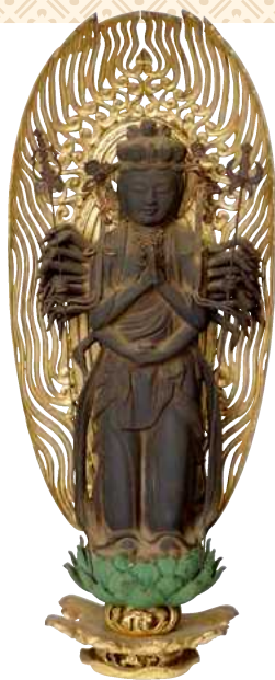
1「朱地井桁紋金箔押旗印」彦根城博物館(後期、前期は別の旗印を展示) 2「太刀 銘来国丸」彦根城博物館 3 静岡県指定文化財「紅糸威腹巻」静岡浅間神社 4「南溪瑞頂相」井伊谷 龍潭寺(後期) 5「世継観音像」井伊谷 龍潭寺 ※会期中、一部作品の展示替えがあります。前期 8/14~9/10 後期 9/12~10/12