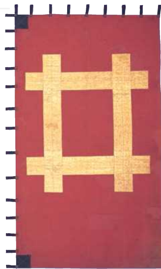
1 関ヶ原の合戦で使用したと伝える井伊家の旗

遠江・井伊谷を領地とした井伊氏。戦国動乱の時代、今川、武田、織田などがしのぎを削るなか、存亡の危機に瀕した家を守るために奮闘したのが、井伊直虎です。この展示会は、周辺の戦国大名の動向を背景に直虎の波瀾の生涯をたどる前半と、井伊氏繁栄への道を切り開いた次代・直政の活躍を描く後半で構成しています。遠江の国衆から、徳川幕府の「譜代筆頭」彦根藩へと駆け上がった井伊氏の苦闘の道のりを、貴重な古文書、刀剣・甲冑などの武具、絵画といった多彩な作品を通してご紹介します。 知られざる静岡の戦国史を、歴史の荒波をくぐりぬけてきた文化財の数々によって、お確かめください。