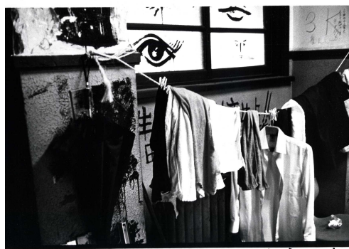
2. 北井一夫 《「バリケード」より：タオル 日本大学芸術学部内》1968年 | 作家蔵