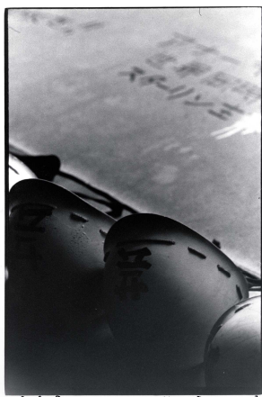
1. 北井一夫 《「バリケード」より ：ヘルメット日本大学芸術学部内》 1968年 | 作家蔵

〔広報用画像〕 展覧会広報用として作品画像をご用意しております。是非、本展をご紹介くださいますようお願いいたします。ご紹介いただける場合は、別紙の申込書に必要事項をご記入の上、FAX又はE-mailにてご連絡ください。