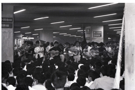
3. 羽永光利 《新宿西口フォークゲリラ》 1969年 | 羽永太郎蔵