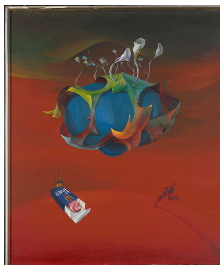
4. 梅田英俊 《Peace》 1966年 | 日本画廊蔵