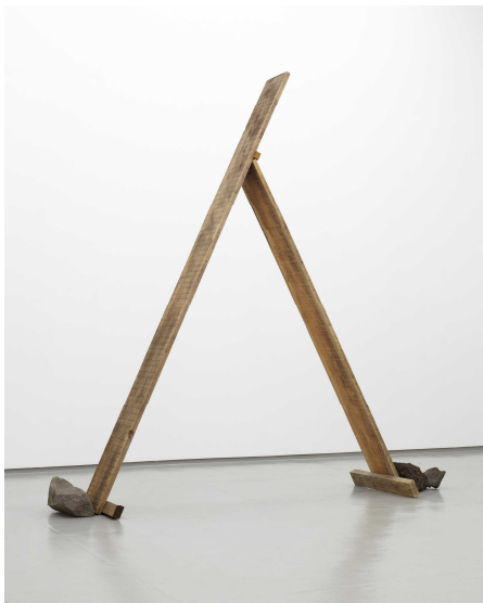
8. 菅木志雄 《斜位相》 1969年 | 作家蔵 | 小山登美夫ギャラリー協力