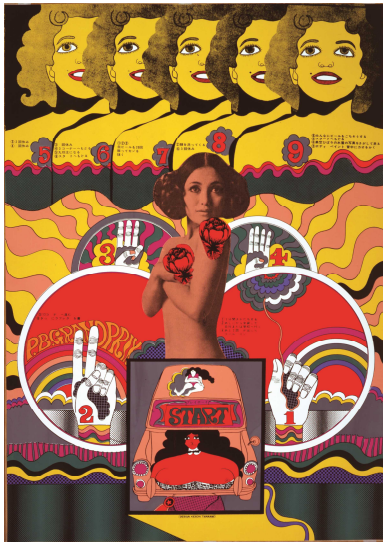
6. 田名網敬一 《P.B.GRAND PRIX》 1968年 | 作家蔵