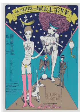
5. 宇野重喜良 天井棧敷 「星の王子さま」ポスター 1968年 | ギャラリー360° 蔵