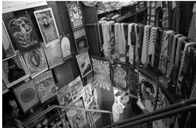
7. 羽永光利 《Fashion Village the Apple》 1968年