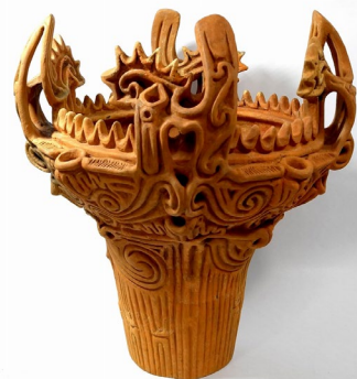
《縄文土器 深鉢 火焰型土器》 新潟県長岡市 岩野原遺跡出土 縄文時代（中期） 國學院大學博物館蔵