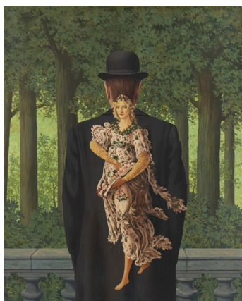
ルネ・マグリット 《レディ・メイドの花束》 1957年 大阪中之島美術館蔵