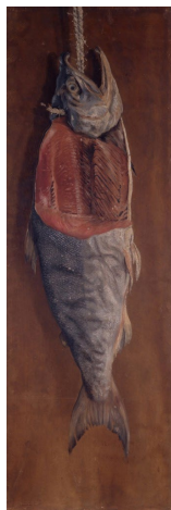
高橋由一 《鮭》 1877年頃（重要文化財） 東京藝術大学蔵