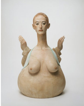
舟越桂 《水に映る月蝕》 2003年 個人蔵

岡本太郎、柚木沙弥郎、志村ふくみ、李禹煥、舟越桂、諏訪敦、山口晃など、放送時の映像とともに制作の過程で作家が語る言葉に耳を傾けながら、創造という行為の深淵を感じてみてください。