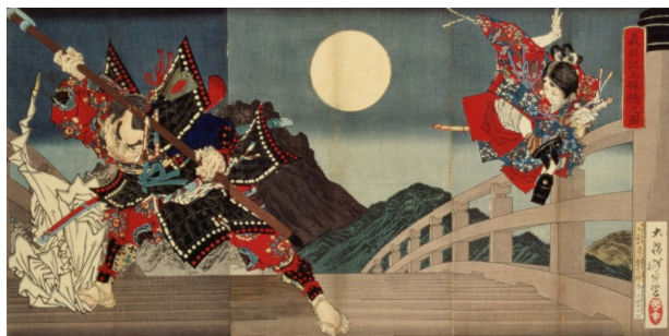
月岡芳年《義経記五條橋之図》 1881年 横浜美術館蔵（加藤栄一氏寄贈）