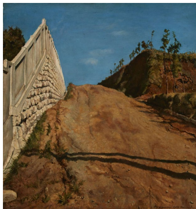
岸田劉生 《道路と土手と堀 （切通の写生）》 1915年（重要文化財） 東京国立近代美術館蔵 ※8/25-9/27展示