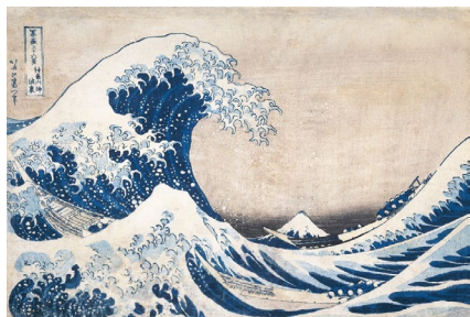
葛飾北斎 《富嶽三十六景 神奈川冲浪裏》 1831年頃 和泉市久保惣記念 美術館蔵 ※9/1-9/27展示

村上隆、大野一雄、井浦新らがつむぐ言葉で、縄文土器・土偶、伊藤若冲、曾我蕭白、葛飾北斎など、日本美術の名品が再び輝きだします。