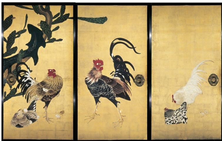
伊藤若冲《仙人掌群鶏図》（部分） 1789年（重要文化財）大阪・西福寺蔵 ※8/25-9/27展示