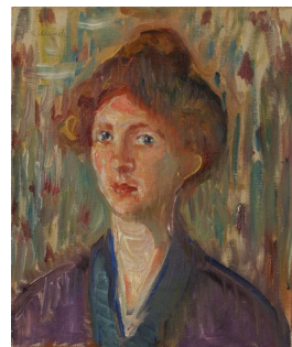
エドヴァルド・ムンク 《ミスナー嬢の肖像》 1907年 ひろしま美術館蔵