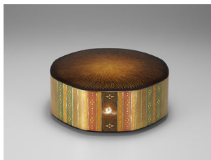
室瀬和美 《蒔絵螺鈿八稜箱「彩光」》 2000年 国（文化庁）※7/18-8/23展示