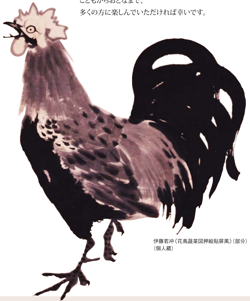
伊藤若冲《花鳥蔬菜図押絵貼屏風》(部分) (個人蔵)