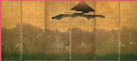
〈武蔵野図屏風〉 静岡県立美術館蔵