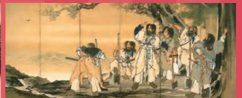
鈴木松年〈神武天皇・素戔嗚尊図屏風〉 個人蔵