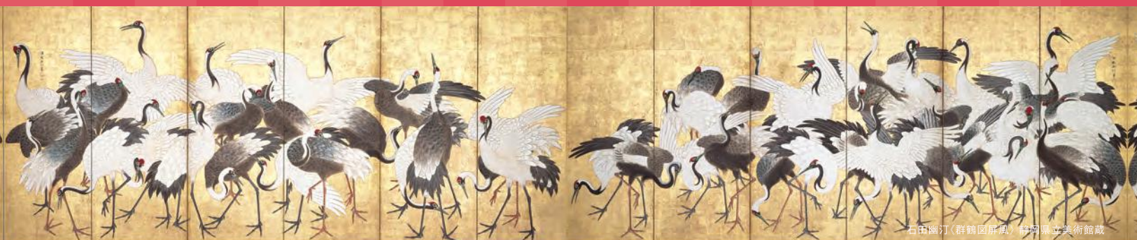
石田國干《群鶴図屏風》 静岡県立美術館蔵

静岡県立美術館 Shizuoka Prefectural Museum of Art