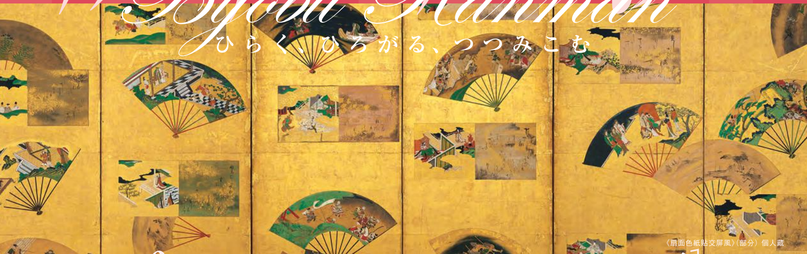
《扇面色紙貼交屏風》(部分) 個人蔵