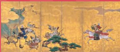
狩野探幽〈一ノ谷合戦・二度之懸図屏風〉 静岡県立美術館蔵