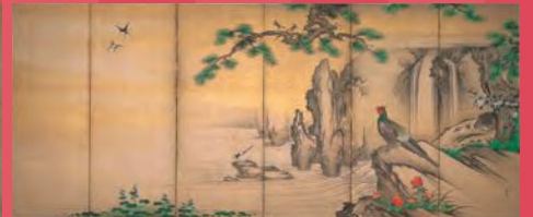
狩野山雪〈四季花鳥図屏風〉 個人蔵