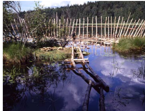
山本裕司《墳墓ーその八》1997年 フィンランド・ラハティ