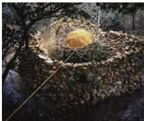
村上誠・渡《産土ーその七》1997-99年 旧引佐郡細江町気賀