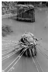
村上誠・渡《産土ーその六》1991年 旧引佐郡引佐町谷下