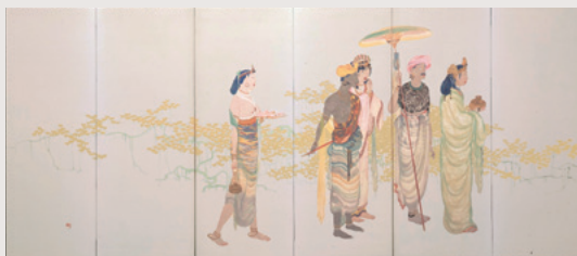
尾竹竹坡「乳供養」(左隻) 個人蔵