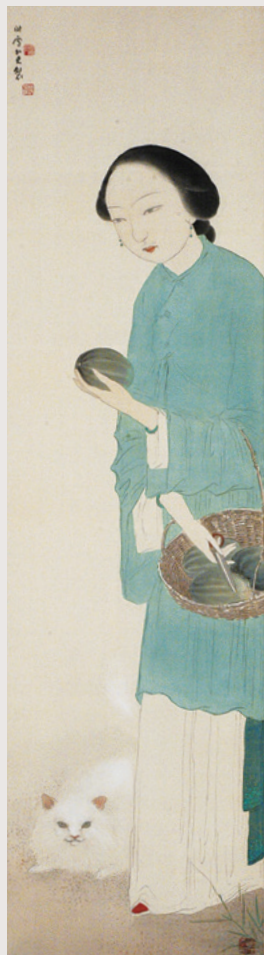
橋本関雪「摘瓜図」静岡県立美術館蔵

静岡県立美術館のコレクションに個人所蔵の重要作を交え、明治から昭和にかけて描かれた日本画をご紹介します。