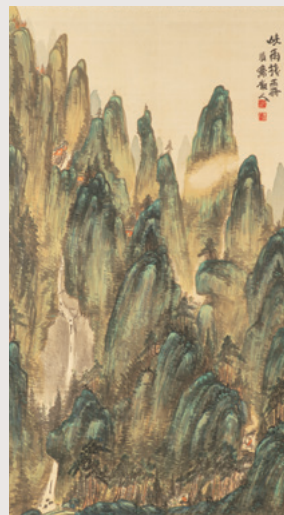
高岡鉄斎「菊園棧道図」静岡県立美術館蔵