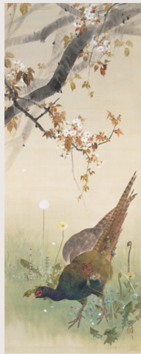
渡辺省亭「十二ヶ月花鳥図」より三月 個人蔵