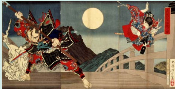
月岡芳年《義経五條橋の園》1881年 横浜美術館蔵(加藤栄一氏寄贈)