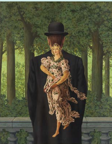
ルネ・マグリット《レディ・メイドの花束》1957年 大阪中之島美術館蔵