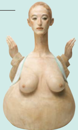
舟越桂《水に映る月蝕》2003年 個人蔵 © Katsura Funakoshi, Courtesy of Nishimura Gallery