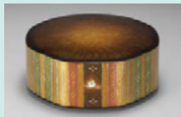
室瀬和美《奇絵蠟燭八種箱「彩光」》2000年 国(文化庁)蔵 ※7/18-8/23展示