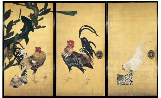
伊藤若冲《仙人掌群鶏図横絵》(部分) 1789年 大阪・西福寺蔵(重要文化財) ※ 8/25-9/27展示