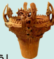
《縄文土器 深鉢 火焔型土器》 縄文時代(中期) 国学院大学博物館蔵

9月12日(土) 14:00 - 15:30 要申込/要観覧券 障害の有無にかかわらず、来館者同士が自由に語り合いながら作品を楽しむ鑑賞会です。