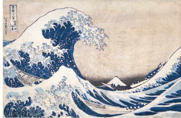
葛飾北斎《富嶽三十六景 神奈川沖浪裏》1831年頃 和泉市久保物記念美術館蔵 ※ 9/1-9/27展示