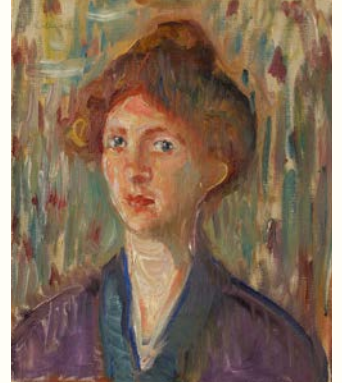
エドヴァルド・ムンク《マイスター嬢の肖像》1907年 ひろしま美術館蔵