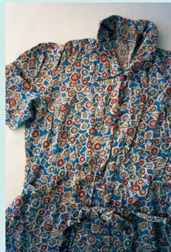
石内都《ひろしま#11 donor: Harada, A.》2007年 作家蔵 © Ishiuchi Miyako/D'orsima#11 donor: Harada, A. Courtesy of The Third Gallery Aya