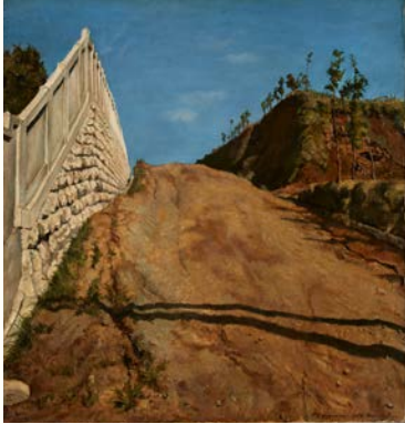
岸田劉生《道路と土手と塙(切通之写生)》1915年 東京国立近代美術館蔵(重要文化財) ※ 8/25-9/27展示