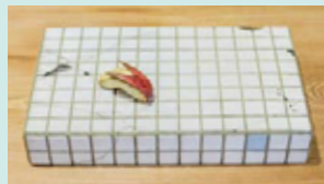
前原冬樹《一刻 タイルに兎林檎》2018年 個人蔵