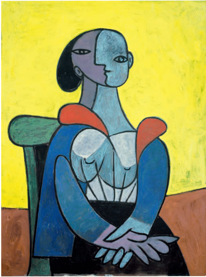
パブロ・ピカソ《黄色い背景の女》1937年 東京ステーションギャラリー蔵 © 2026 - Succession Pablo Picasso - BCF (JAPAN)