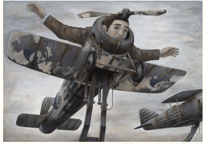
石田徹也《飛べなくなった人》1996年 静岡県立美術館蔵