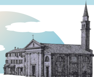
カナレット《ドーロ風景》(部分) 1740年以降 静岡県立美術館