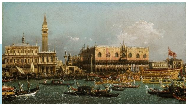
カナレット《昇天祭、モロロ河岸のプチントーロ》1760年 油彩、カンヴァス、ダリッジ美術館 Dulwich Picture Gallery, London