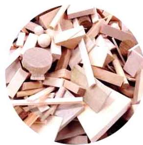
(材料協力) 常木教材株式会社